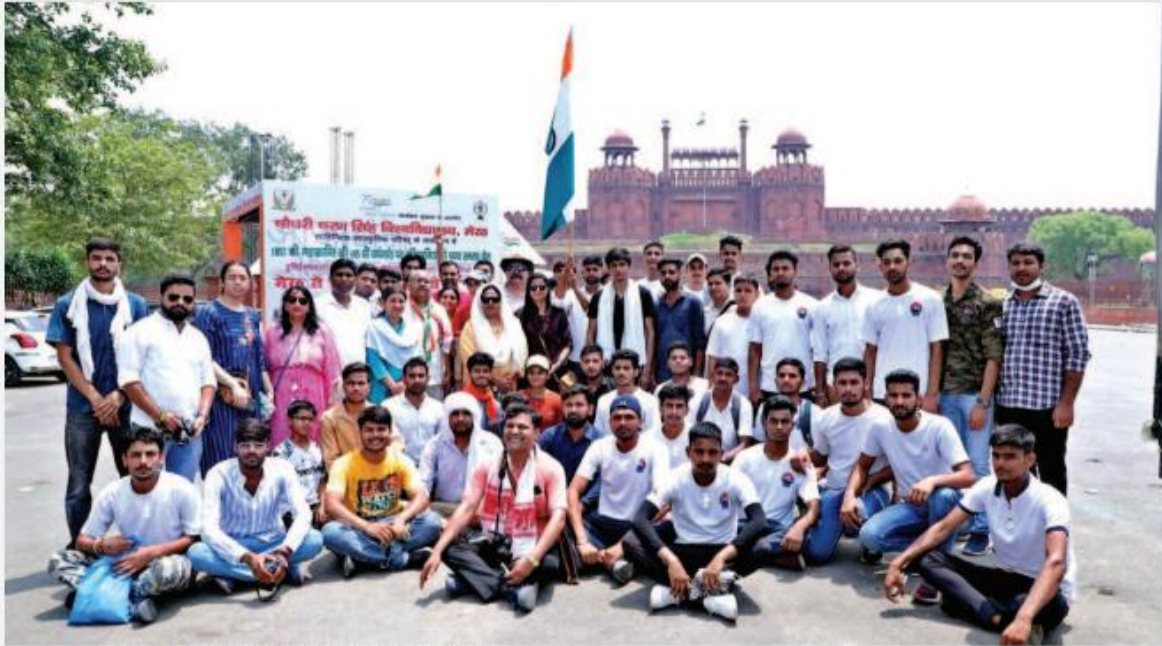
Teachers and students of Chaudhary Charan Singh University, Meerut at Red fort